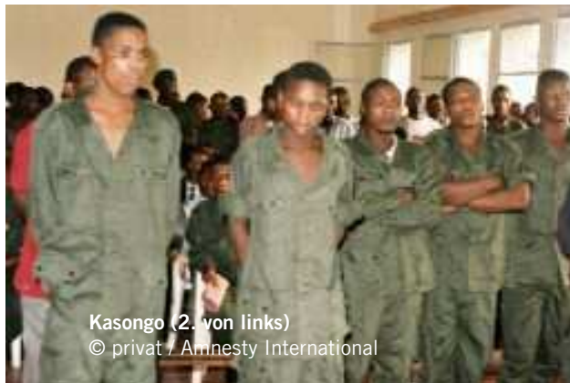
Kasongo (2. von links)

Die DR Kongo ist Vertragspartei des Internationalen Paktes über bürgerliche und politische Rechte und des Übereinkommens über die Rechte des Kindes.