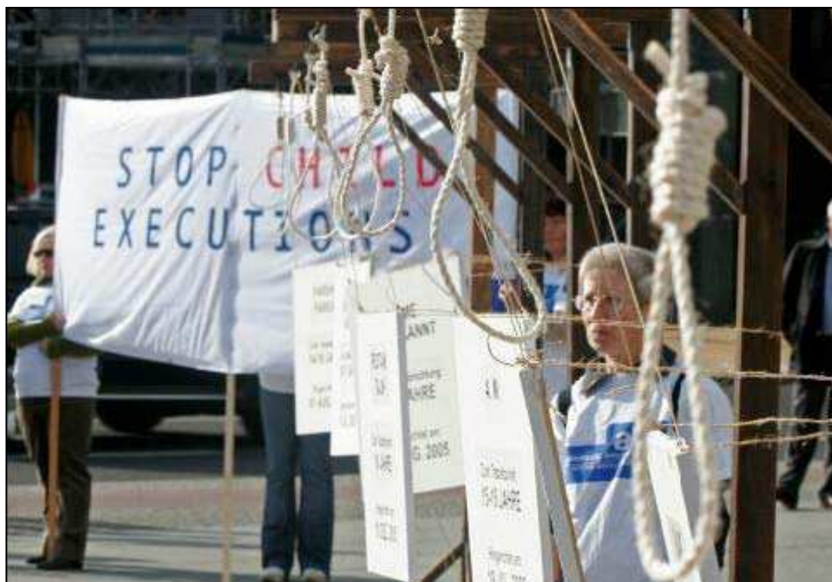
Demonstration von Amnesty International in Berlin am 10. Oktober 2006, dem „Internationalen Tag gegen die Todesstrafe“