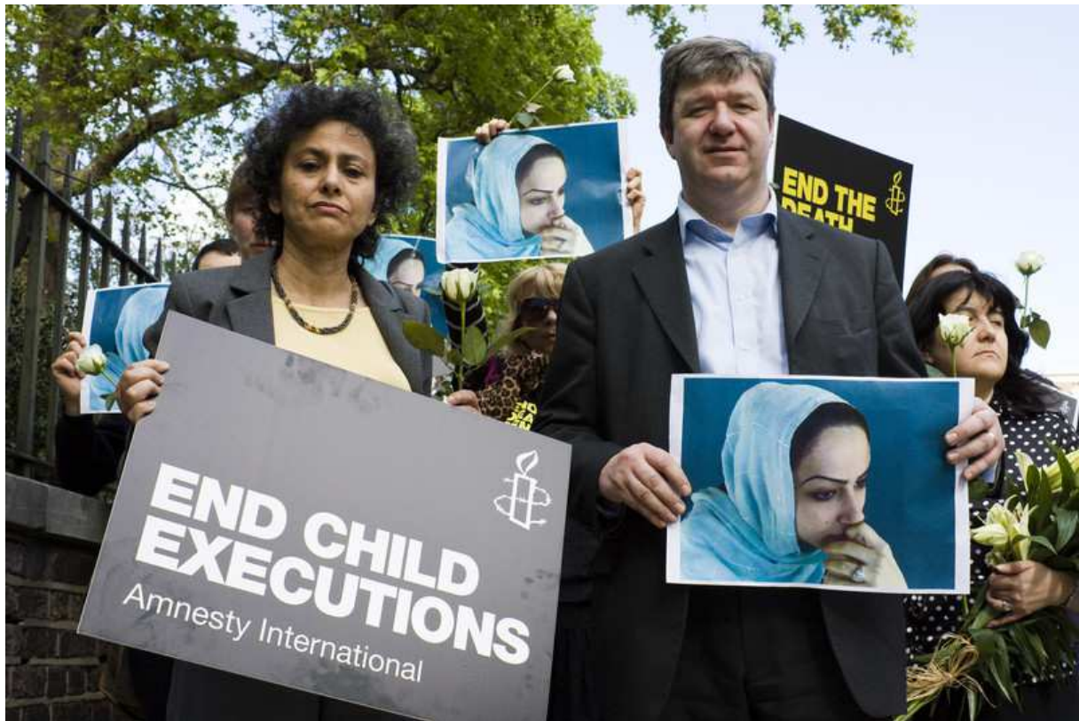
Demonstration von Amnesty International am 6. Mai 2009 vor der iranischen Botschaft in London. Anlass war die Hinrichtung der zur Tatzeit Minderjährigen Delara Darabi fünf Tage zuvor.